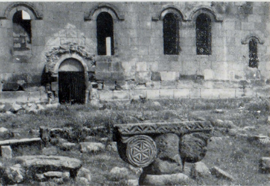
Հարավային ճակատի հատված

րիսպների մնացորդները պահպանվել են գյուղի արևմտյան ծայրամասում: