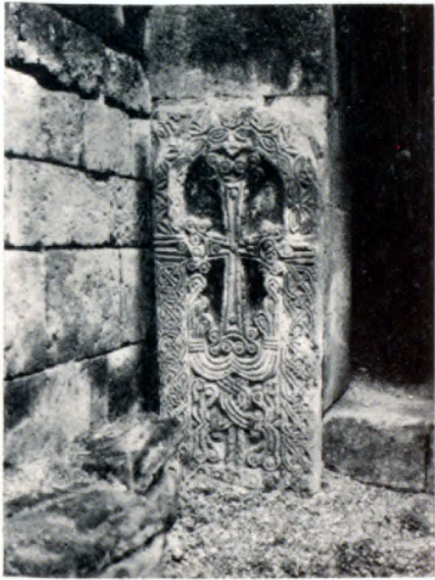
Միածանաձոր խաչքարը եկեղեցու ներսում:

կու կողմում գտնվում են քառակուսի ավանդատներ: Նավերը ծածկված են եղեչ կիսագլանաձև թաղերով՝ առնված առանձին (միջին մասը բարձր) կտորների տակ: Ունեցել է երկու մուտք՝ հարավից և արևմուտքից (վերջինս ներկայումս փակված է): Արևմտյան պատում կան սյունով բաժանված զույգ պատուհաններ: Հյուսիսային պատին կից ուղղանկյուն կտրվածքով զույգ որմնամույթերի մնացորդներից (որոնք շեղված են T-աձև մույթերի լայնական ուղղությունից) երեկում է, որ եկեղեցին վերակառուցվել է՝ նախնական փայտաշեն ծածկը փոխարինելով թաղակապով: