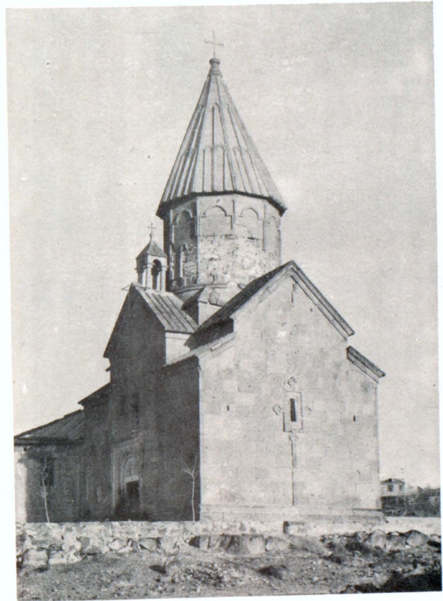
Մարինե եկեղեցին հարավ-արևելից