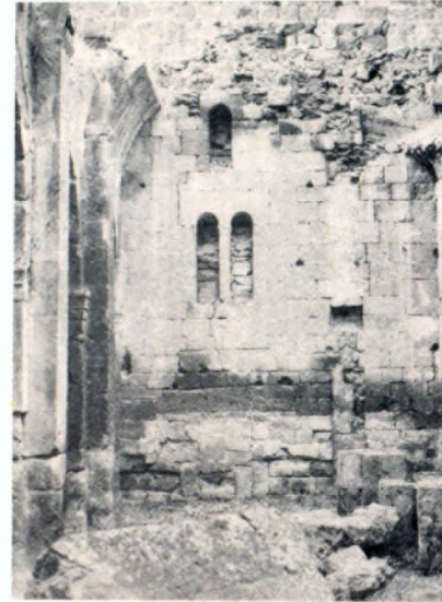
Միւրանվար եկեղեցու արևմտյան ներքին տեսքը

յին ուշագրավ ներդաշնակումներ, որով թողնում է կատարյալ գեղաբանդակի տպավորություն: Պահպանված է անաղարտ վիճակում (նախնական կղմինդրի ծածկով): Գմբեթի թմբուկը ութանիստ է, անցումը ուղղանկյուն հիմքից կիսագնդաձև թաղին իրականացված է երկշաբթ տրոմպների միջոցով: Ներքուստ հետագայում ծածկվել է սվաղով, որի մնացորդների վրա կան որմնանկարների հետքեր: Ճակատների հարդարանքում աչքի են ընկնում թեների ծավալների հյուսածո զարդանախշերով ծածկված թեքադիր կտրվածքով քիվերը: Ունի պատերը գոտկող անթվակիր շինարարական արձանագրություն: Կառուցված է դարչնակարմրավուն տուֆի սրբատաշ խոշոր քարերով: Մրջափակված է անկանոն եզրագիծ ունեցող պարսպով, տարածքում կան XI—XIV դդ. խաչքարեր: