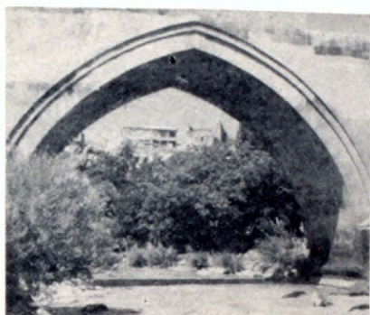
Աշտարակի կամրջի մեծ բոխչբ