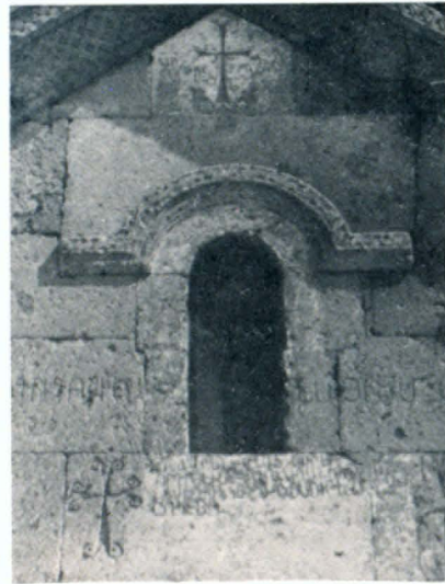
Կարմրավոր եկեղեցու հարավային պատուհանը

Աշտարակի պատմական հարուստ անցյալի խոտուն վավերագրերն են նրա տարածքում գտնվող զգալի թվով արժեքավոր պատմաճարտարապետական հուշարձանները: Միտանավոր եկեղեցին (V դ.) դրանցից ամենավաղ կառուցվածն է: Այն 19,15×9,40 մ շտփերով եռանավ դահլիճ է, տեղադրված Քասաղ գետի ձորաբերանին: Պահպանված են պատերը, արևելյան թևը, հարավային նավի կիսադանակ ծածկը (եկեղեցին մասնակիորեն վերականգնվել է 1963—64 թվականներին): Շենքն անսովոր դարձնելու նպատակով XVII դ. հյուսիսային և արևմտյան պատերը առնված են բարձր կրկնապատերի մեջ, հարավային պատի ծածկից վերև ընկած մասում ստեղծված են հրակնատներ: Պայտածն խորանի եր-