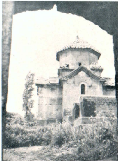
Կարմրավոր եկեղեցին հարավից

«Պատմական հուշարձանների և կուլտուրական մյուս արժեքների պահպանության նկատմամբ հոգատարությունը Հայկական ՍՍՀ ֆաղաֆացիների պարտքը ու պարտականությունն է»: (ՀՍՍՀ սահմանադրություն, հոդված 66)