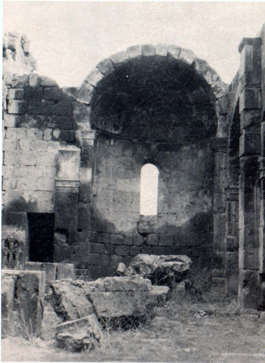
Միւրանվար եկեղեցու խորանը