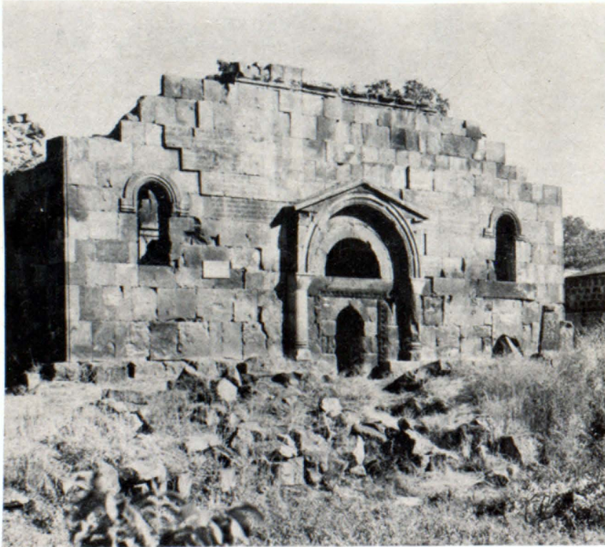
Տաճարի տեսքը արևմուտքից

Տաճարի ներսի միասնական տարա- ժույթունը կազմավորվում է կիսակլոր արսիդ-հենախորշերով, որոնք կրում էին զմբեթային ողջ համակարգը: