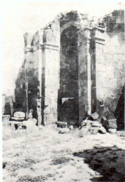
Հարավ արևելյան մույթը